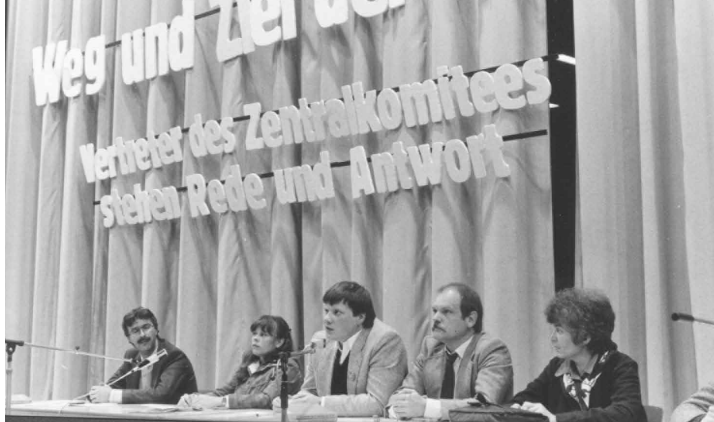
Manifestation à l'occasion de la fondation de parti du MLPD en 1982. Au milieu Stefan Engel.

on peut détruire la société socialiste ! » 6 L'enseignement du mode de pensée a été développé de manière créative par le MLPD à partir du livre de Stefan Engel « La lutte pour le mode de pensée dans le mouvement ouvrier », le numéro 26 de l'organe théorique VR , puis résumé et appliquée aux questions actuelles . La question du mode de pensée a encore considérablement gagné en importance depuis. Le mode de pensée petit-bourgeois adopte en apparence une position critique vis-à-vis du capitalisme tout en le défendant contre toute alternative sociale. Entre-temps, le gouvernement utilise tout un système du mode de pensée petit-bourgeois comme principale méthode de gouvernement . D'en venir à bout, c'est la base pour que les masses populaires choisissent la voie de la lutte de classe prolétarienne.