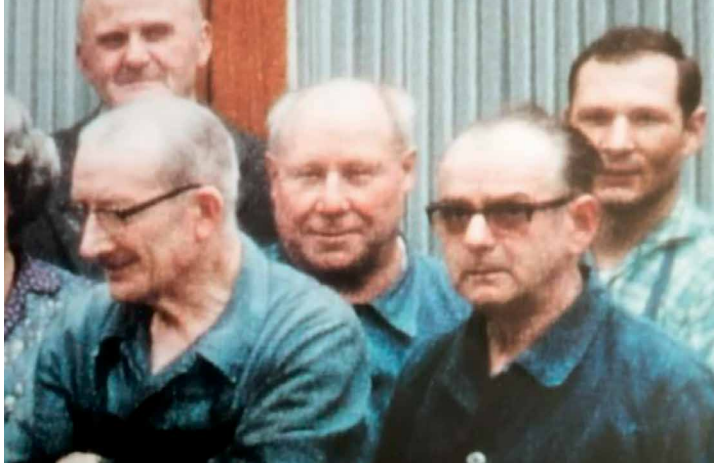
Lors de son dernier jour de travail avant la retraite en 1969

étroitement lié aux préoccupations et aux besoins des gens simples. Il a résisté à toutes tentatives de corruption . Ainsi, il a refusé lorsque les Américains lui ont proposé, en 1945, une villa cossue d'anciens fascistes, alors qu'il était un homme politique local de premier plan. Après l'interdiction du KPD en 1956, il est naturellement retourné à l'usine en tant que serrurier.