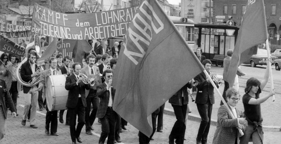
KABD (Union des ouvriers communistes d'Allemagne) lors de la manifestation du 1 er mai 1977 à Mannheim.

ne peut plus être la révolution modèle de l'avenir, mais qu'il faut préparer la révolution socialiste internationale.